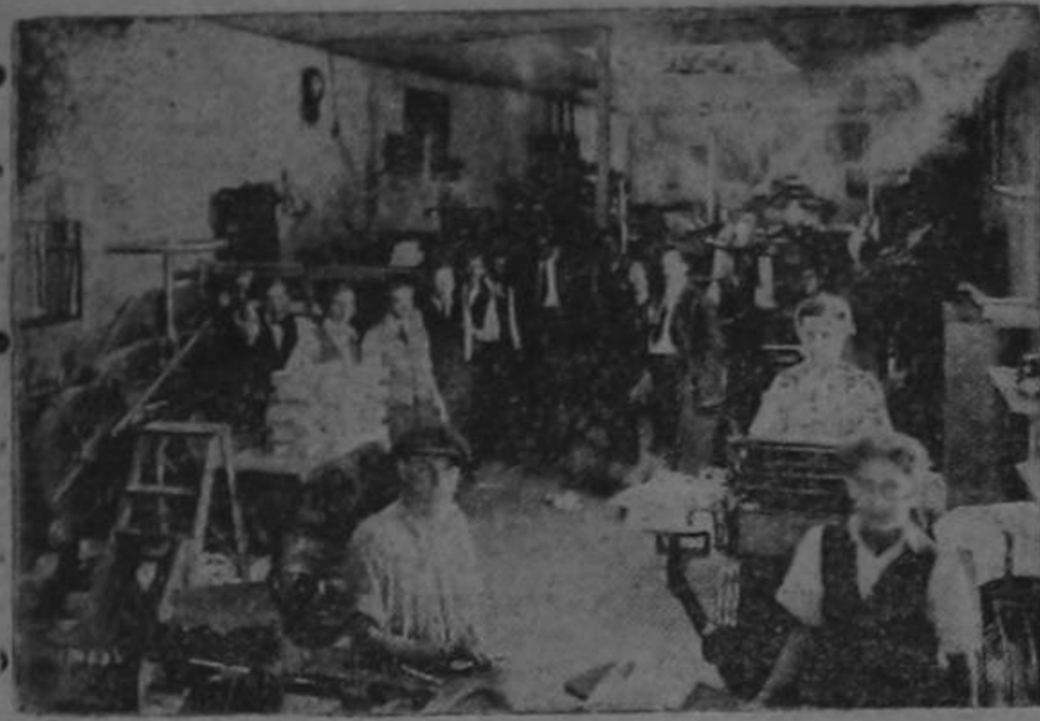
Talleres del DIARIO DEL COMERCIO y grupo de trabajadores

Sin vanos alardes; cumpliendo lealmente con su deber; atacando cuanto ha juzgado malo e inconveniente para los intereses de la nación; no