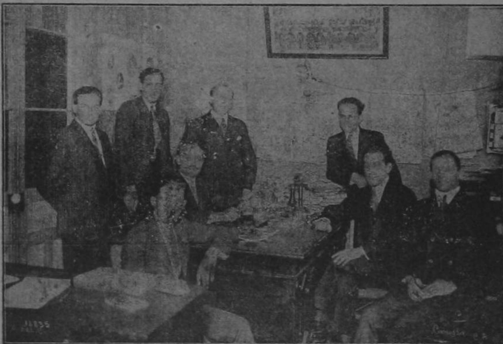
Otro grupo tomado recientemente en nuestras oficinas