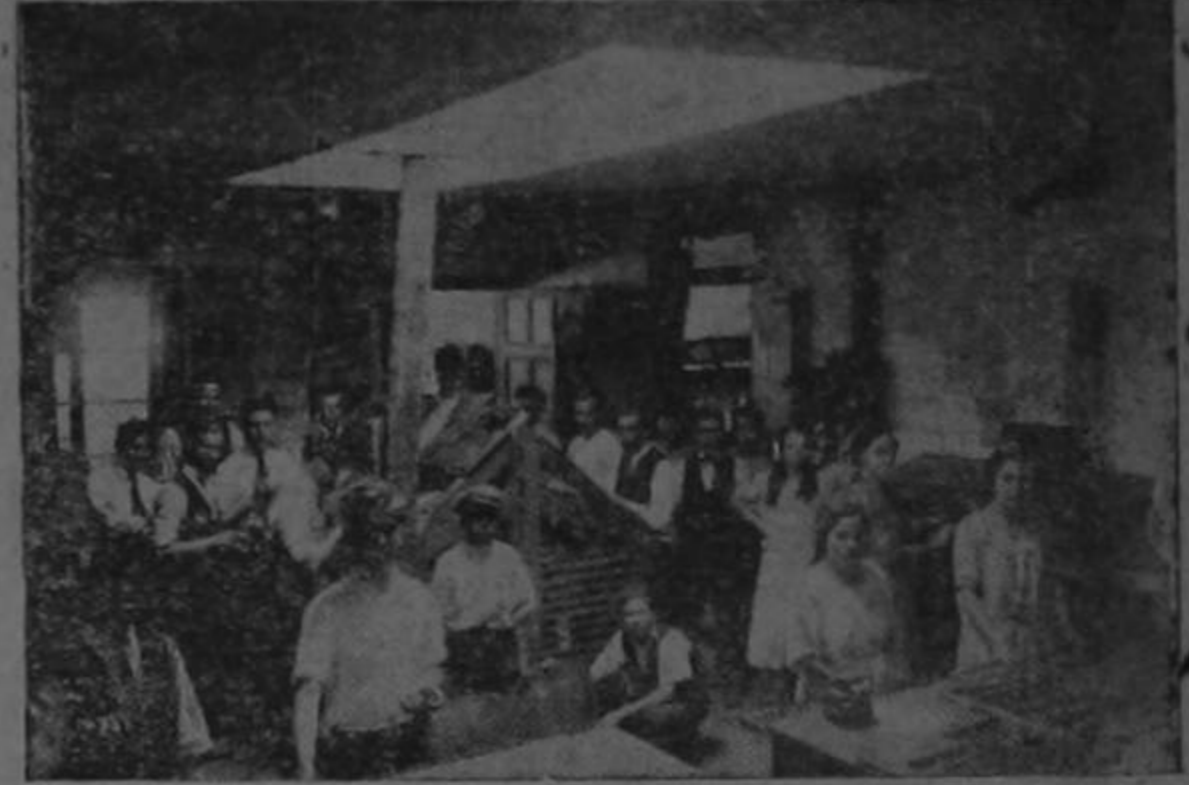
Otro aspecto del taller en uno de los departamentos interiores

administración y los 52 agentes que tenemos en los principales pueblos y ciudades de la República, y cuyos nombres aparte publicamos, se llegará al convencimiento de que una empresa de esta clase—en que honradamente se ganan el pan más de cien trabajadores—no es ni mucho menos labor de vagabundos como ha tenido a bien declarar repetidas veces el soñador Presidente de la República don Julio Acosta García, próximo felizmente a terminar sus mal desempeñados papeles de gobernante.