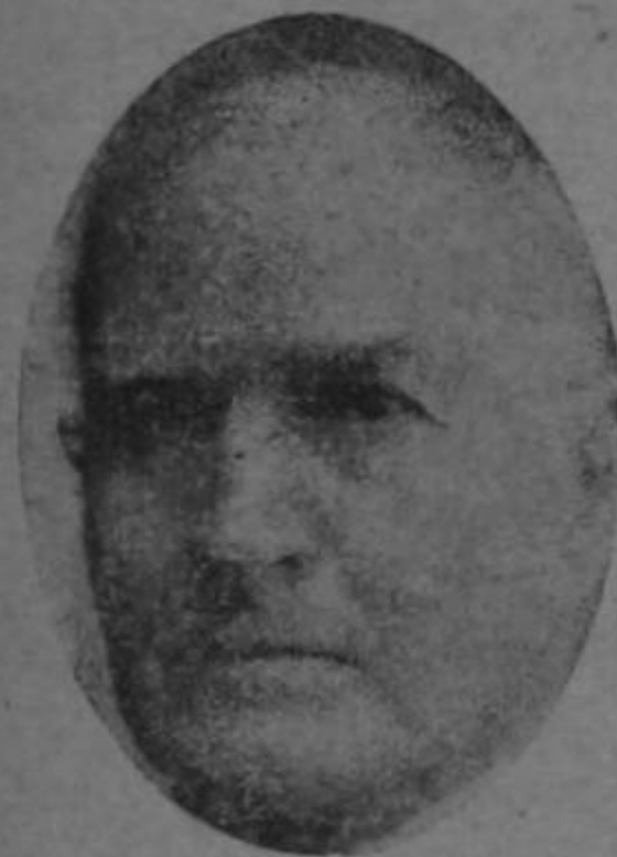
General don Juan Bautista Quirós, ex-Presidente de la República, accionista

Publicamos en esta página, además de las fotografías tomadas en los talleres y Direc-